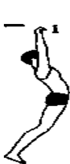
«Нет фиксации» Рис. 8.1